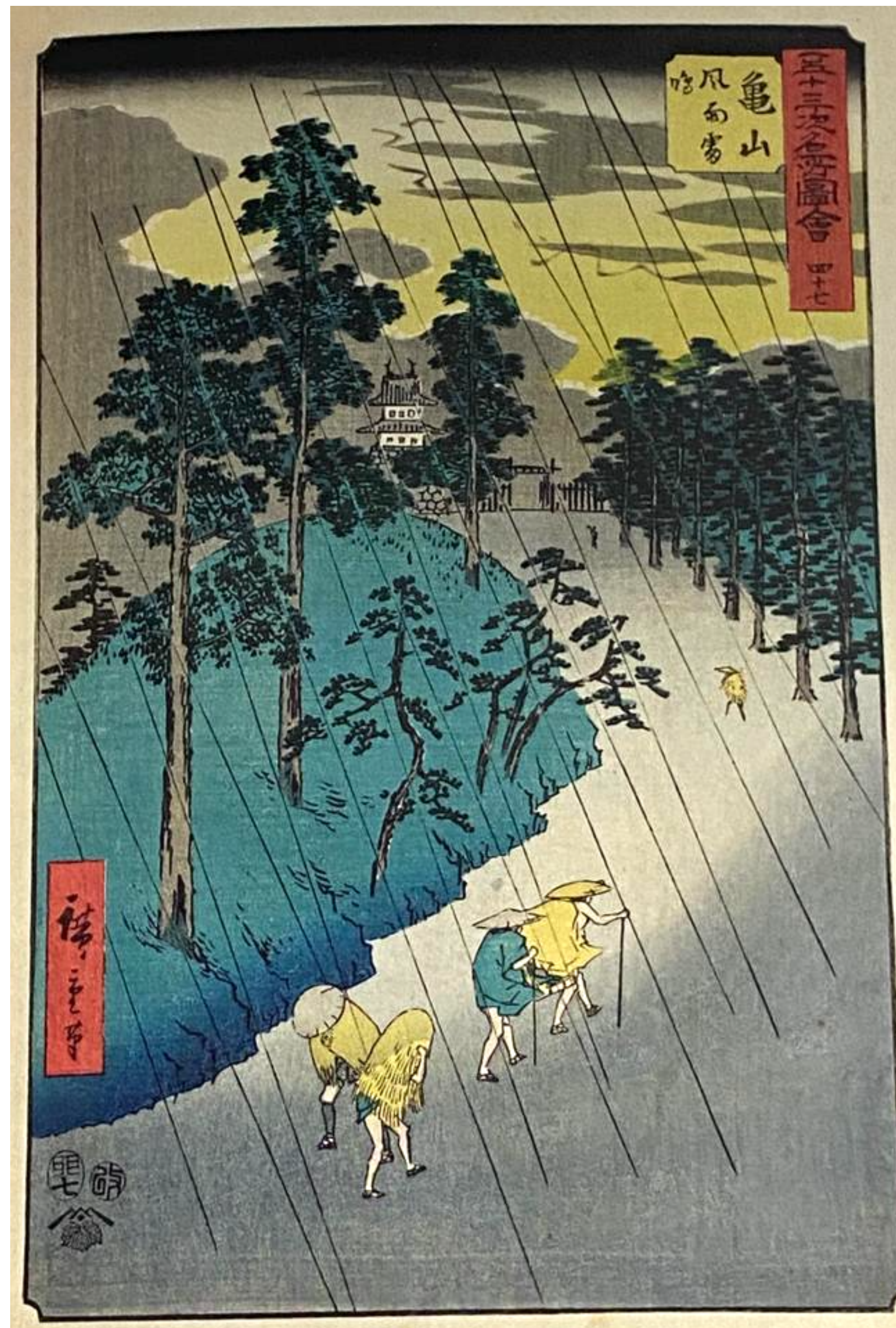
8 - KAMEYAMA, VENTO, PIOGGIA E TUONI