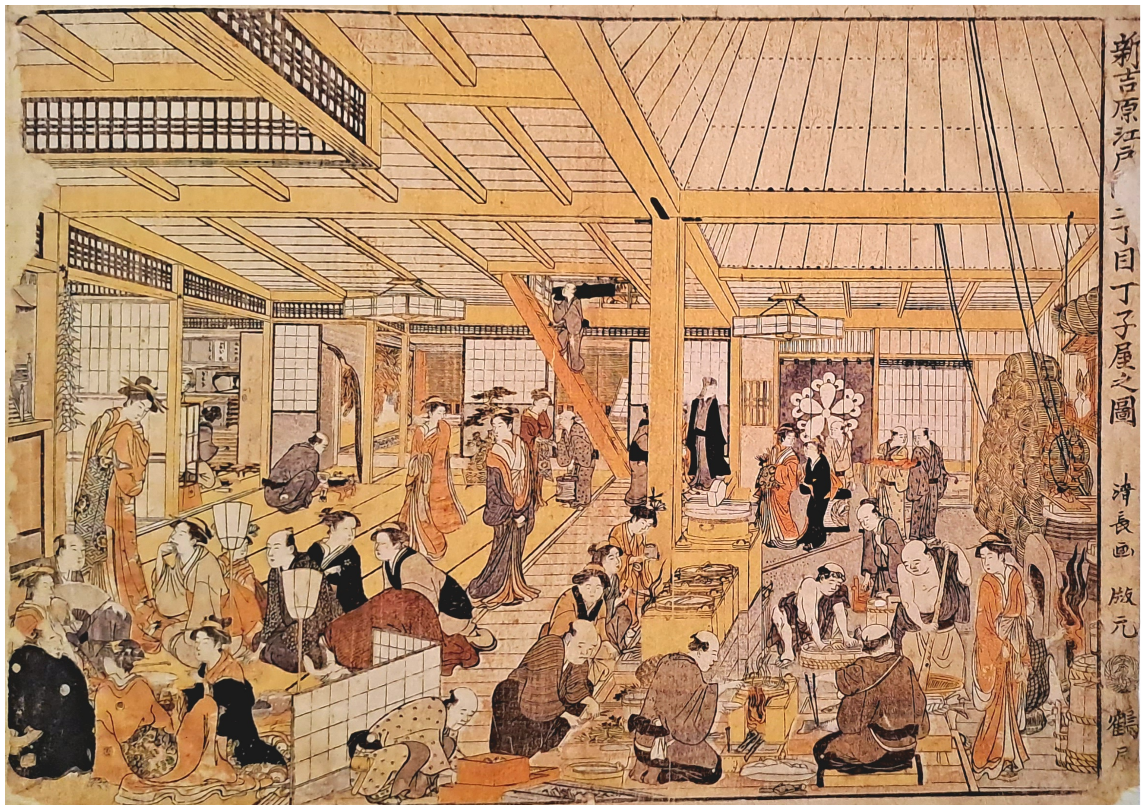
4 - INTERNO DI UNA CASA DI PIACERE NELLA PRIMA META' DEL 1700