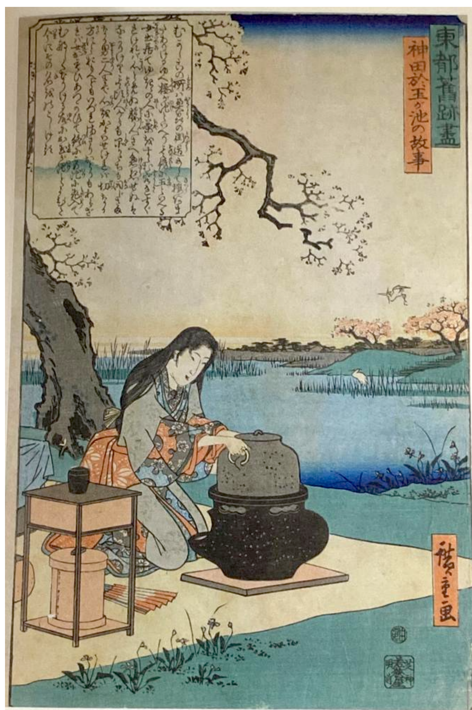
7 - LO STAGNO DI OTAMA A KANDA