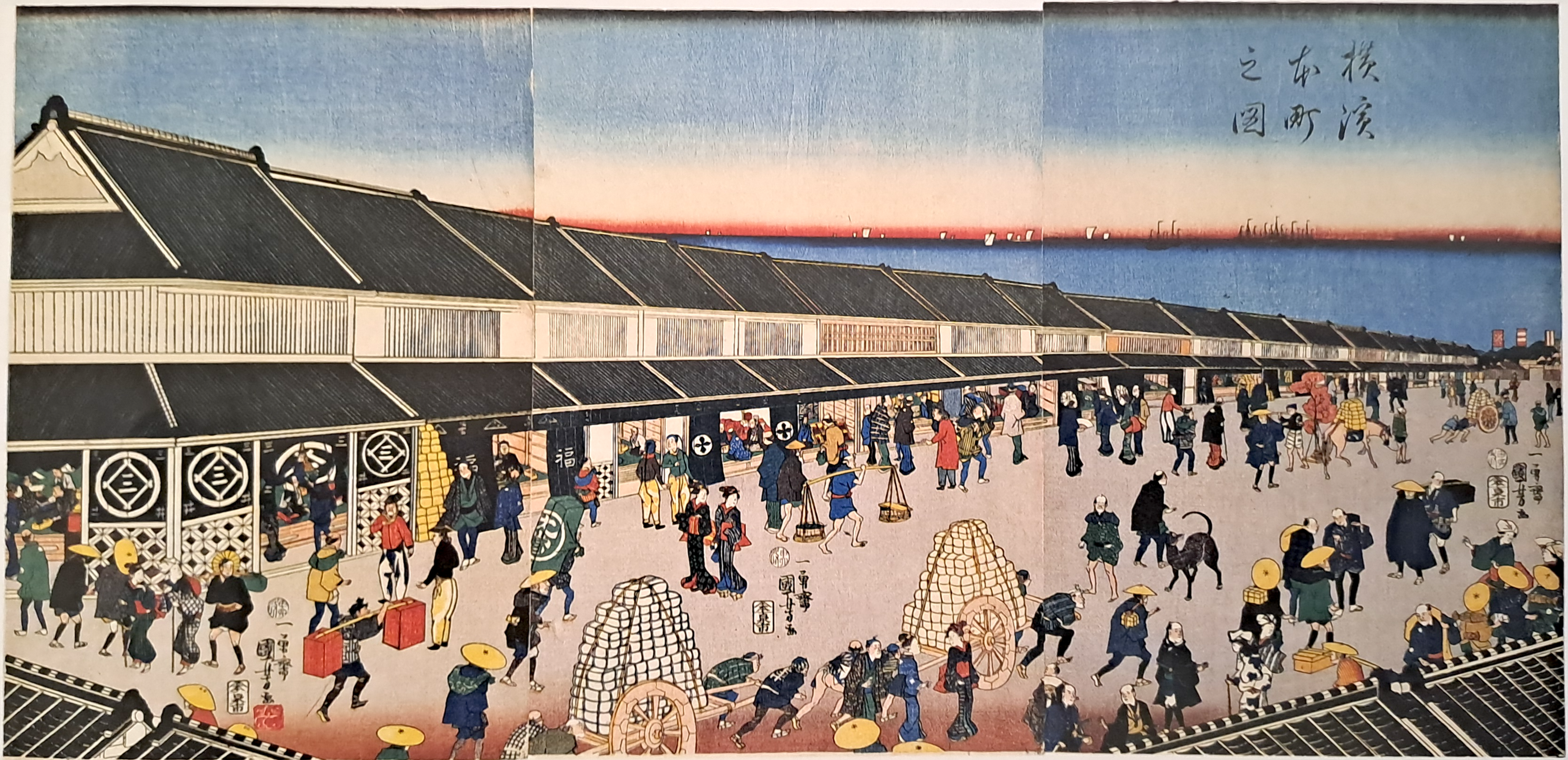
3- LA CITTA' DI YOKOHAMA NEL 1700