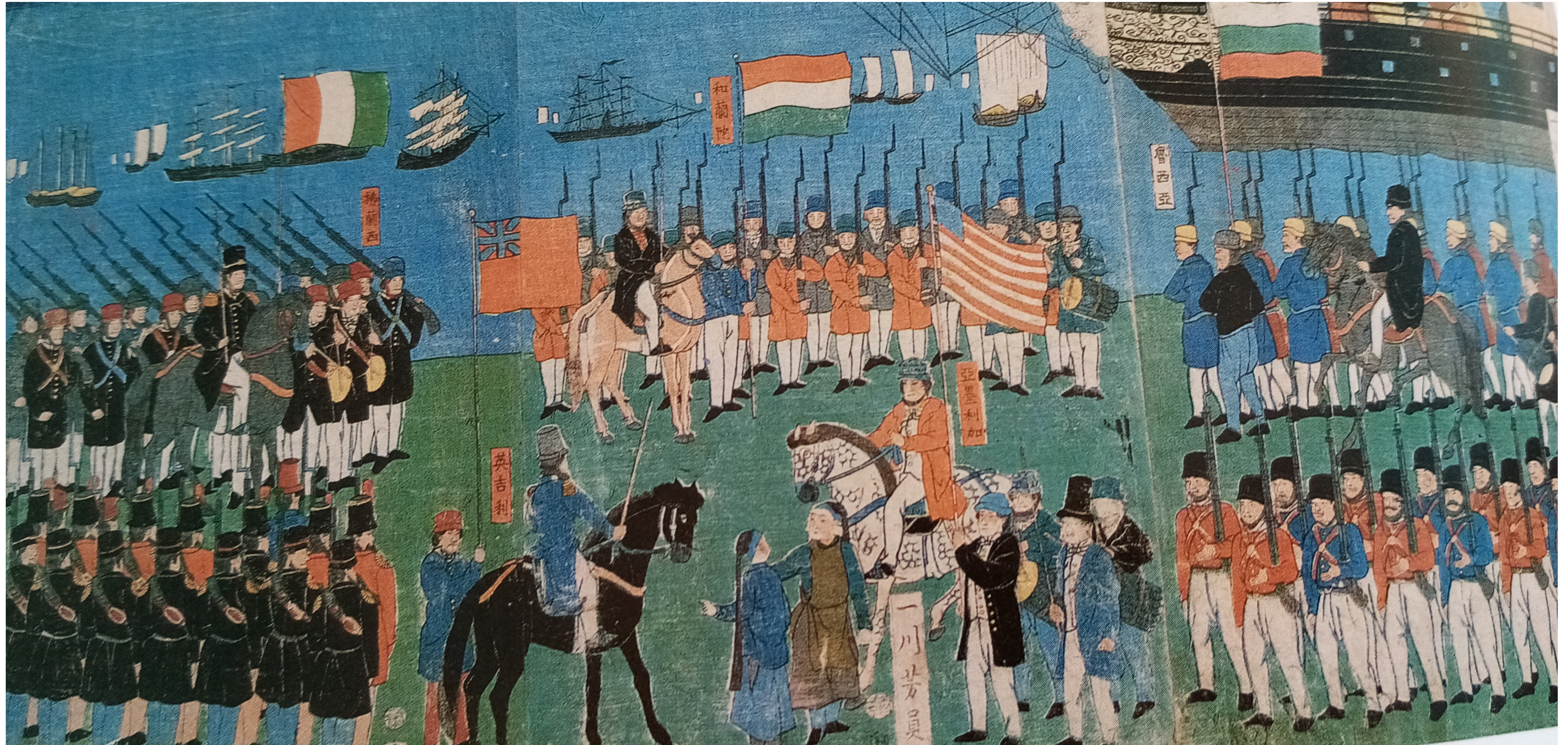
42 - SBARCO DEI FORESTIERI A YOKOHAMA