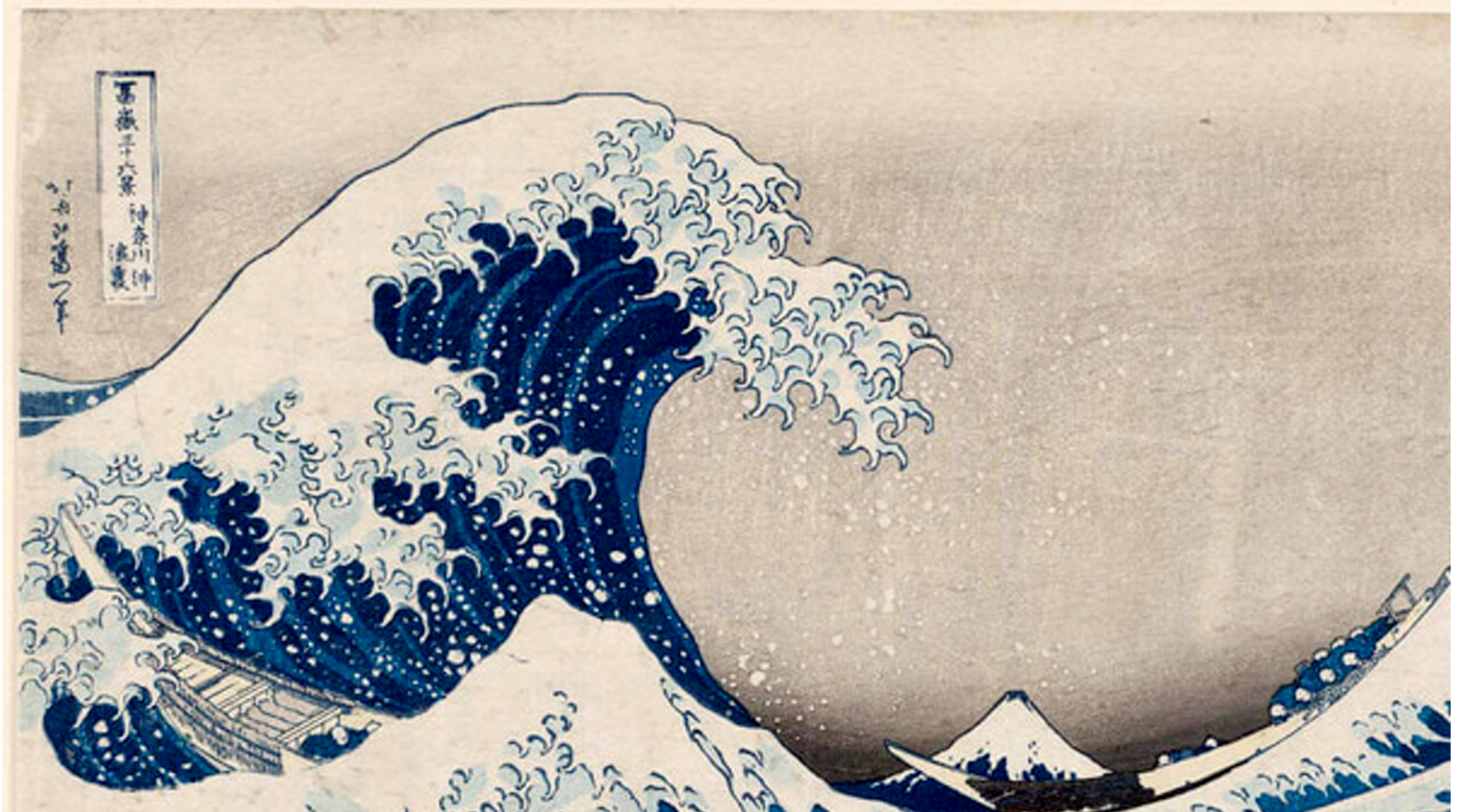
41 - HOKUSAI: LA GRANDE ONDA