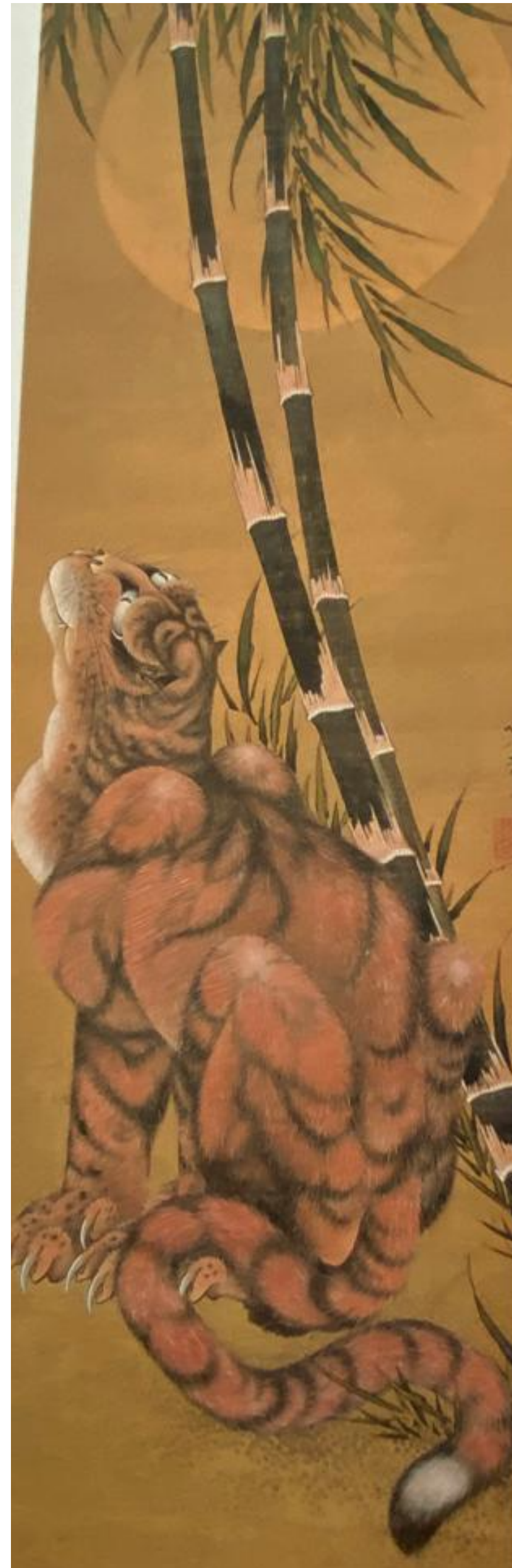
39 - LA TIGRE CHE GUARDA LA LUNA