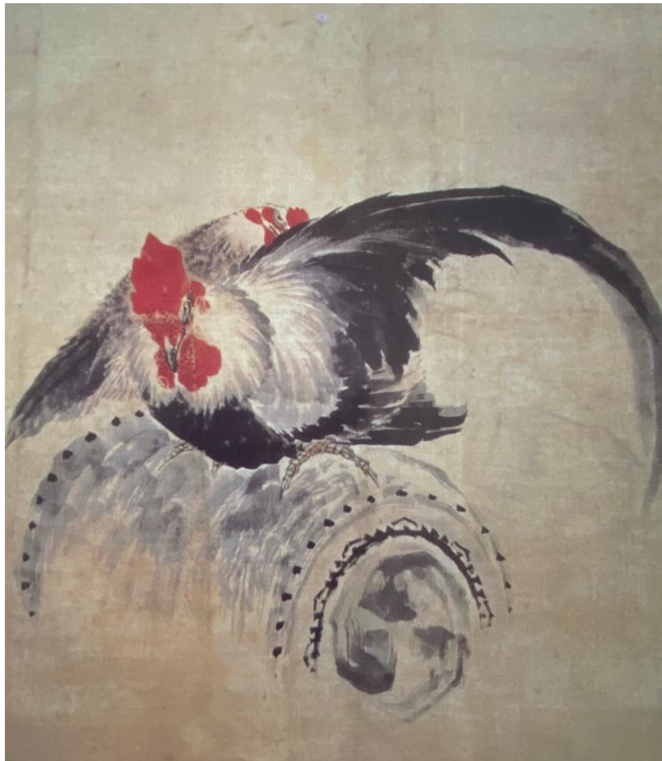
37 - GALLO E GALLINA SU TAMBURO DA GUERRA